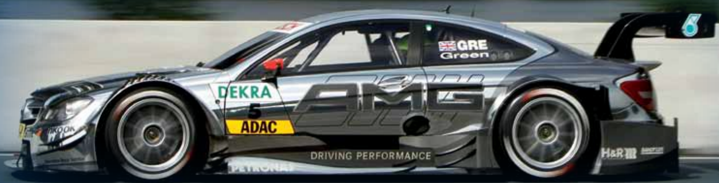
MERCEDES AMG C-COUPE (Deutsch Tourenwagen Masters, DTM 2012 season)