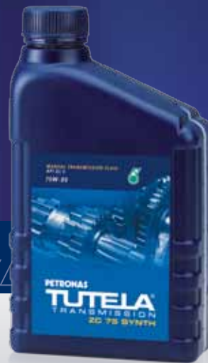
ZC 75 SYNTH

Multigrade synthetic lubricant for the mechanical transmissions of cars to be used in transmission-differential units also fitted with hypoid gear pair and central differential (PTU). Special EP/anti-wear additives Fuel economy product. Excellent temperatureoxidisation resistance properties.